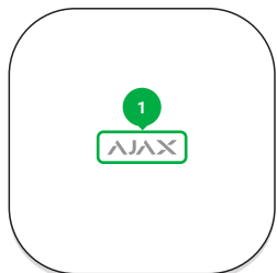
1 - Логотип со световым индикатором.